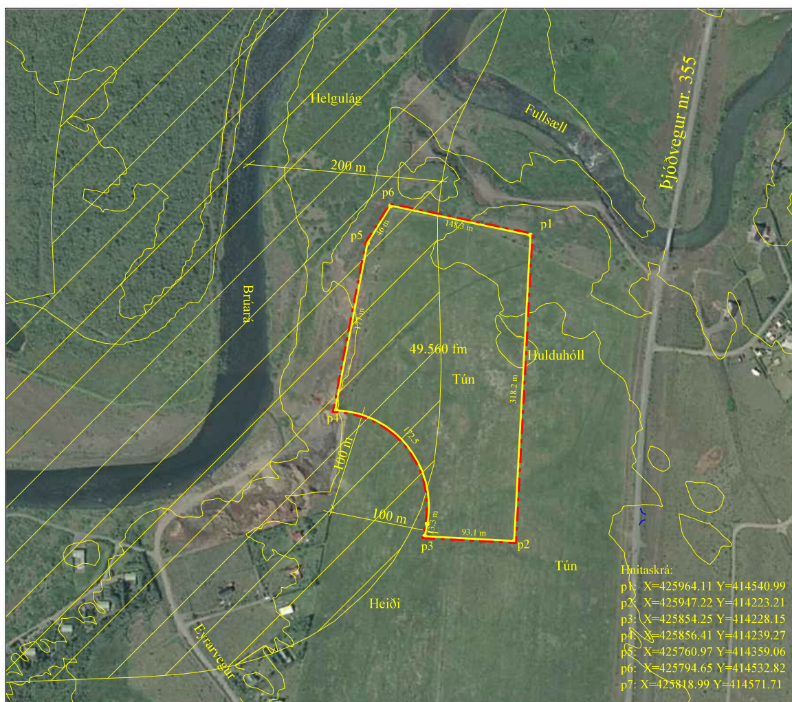
Loftmynd sem sýnir afmörkun efnistökusvæðisins

3.325 m 3 að meðaltali á ári, en reiknað er með að efnistakan geti þó verið breytileg eftir því hvernig eftirspurn eftir efni verður háttáð. Austan við umrædda efnisnámu er merkt náma á aðalskipulagi sveitarfélagsins. Ekki er ráðgert að taka efni þar.